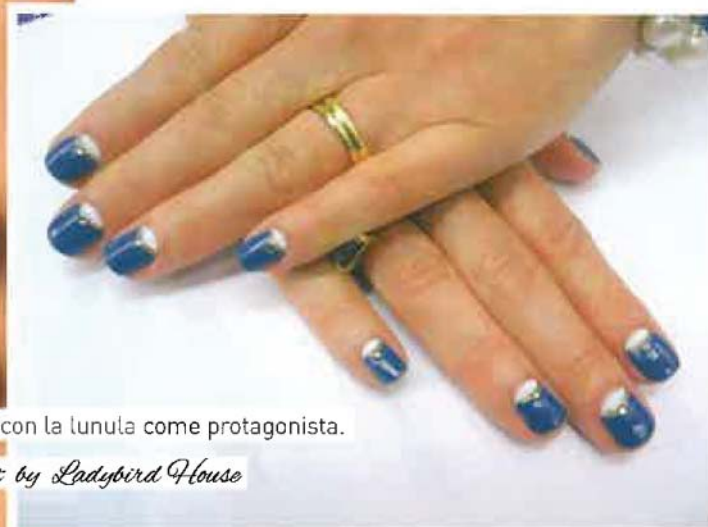
Giochi di contrasti con la lunula come protagonista.