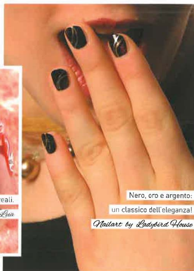
Nero, oro e argento: un classico dell'eleganza!