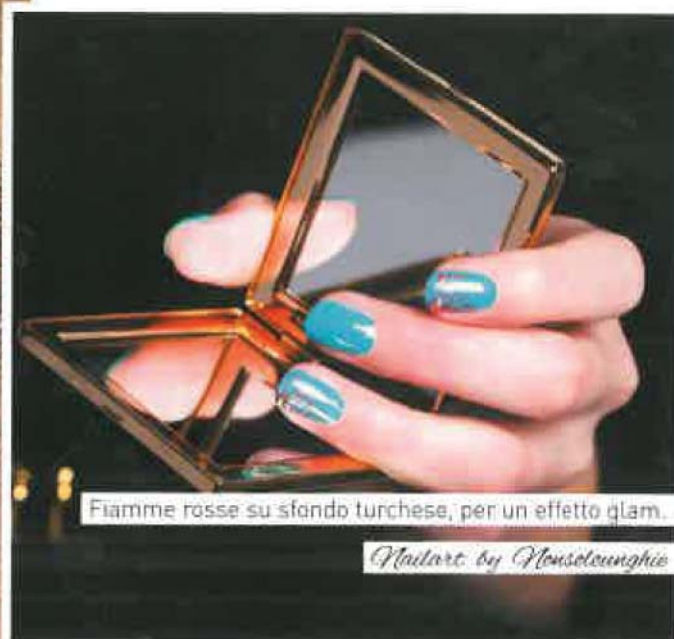
Fiamme rosse su sfondo turchese, per un effetto glam.