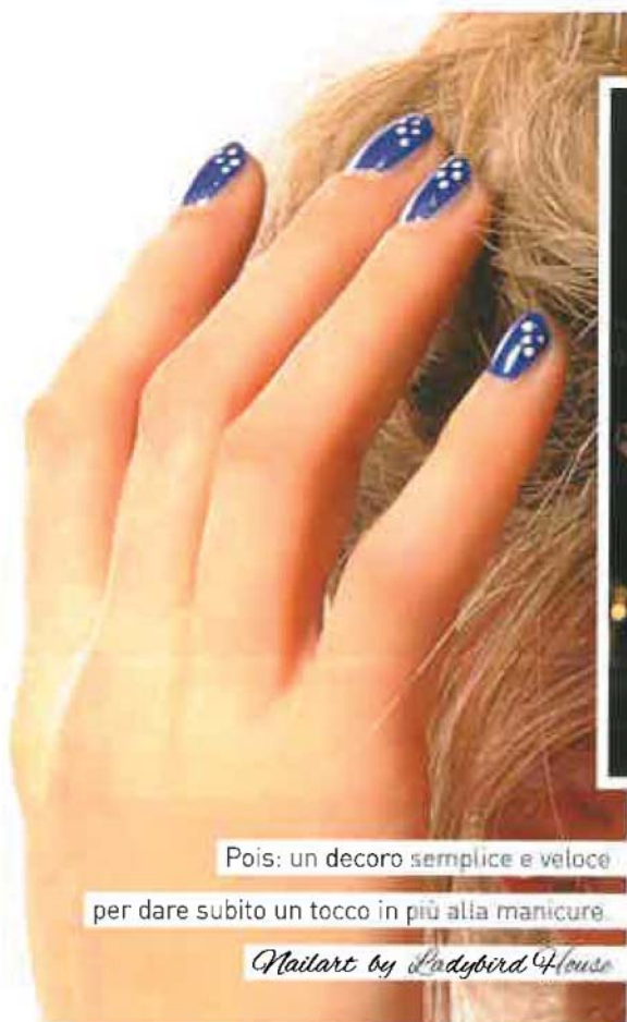
Pois: un decoro semplice e veloce per dare subito un tocco in più alla manicure.