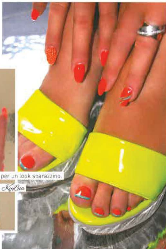
Nailart a effetto neon-chic, per un look sbarazzino.