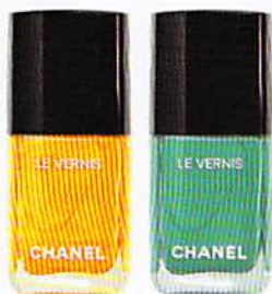
COLLEZIONE NEAPOLIS, N. 592 GIALLO NAPOLI E N. 520 VERDE PASTELLO, CHANEL (€ 25).