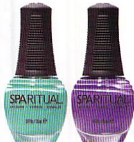
100% VEGANI: THUNDER ROAD (VIOLETTA) E DELIGHT (CELESTE), SPARITUAL (€ 21,90).

L a regina Elisabetta II, 92 anni, indossa da 30 la stessa sfumatura di rosa: Ballet Slippers di Essie, una nuance delicata, tra i best seller del marchio. E sebbene non si possa vedere spesso la mano nuda della sovrana (per via dei guanti) è dunque un pastello il suo favorito, anche per il più disinvolto abbinamento con i toni sgargianti degli abiti che indossa, per dare modo ai sudditi di individuarla sempre. Non è facile portare un total look pastello. Sinceramente, se non sei una testa coronata, rischia di essere troppo sdolcinato. Gli smalti offrono l'espedito per esprimere il proprio lato giocoso e anche per mostrare di conoscere la moda, senza subirla. «Il bello delle Collezioni Smalti è che, pur proponendo uno stile e una tendenza ben definiti dalle passerelle, spesso li raccontano in maniera articolata, declinandoli in varie nuance (solitamente sei) che differiscono per tonalità, texture e finish», dice Monica Mistura, Art Director Ladybird