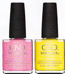
SMALTI VINYLUX NELLE TONALITÀ CANDIED (ROSA) E JELLIED (GIALLO). CND (€ 17,90).