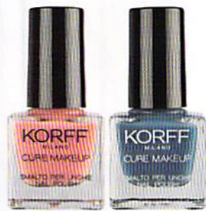
CON CALCIO E VITAMINA E: N. 03 ROSA E N. 14 CARTA ZUCCHERO, KORFF (€ 7).