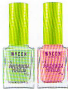
FORMULA DENSA E COPRENTE: RAINBOW NAILS IN ROSA E VERDE, WYCON (€ 3,90).