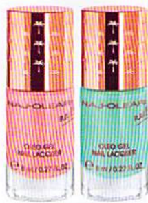
EFFETTO SPECCHIO CON OLI NUTRIENTI: OLEO GEL NAIL LACQUER, NAJOLEARI (€ 8).